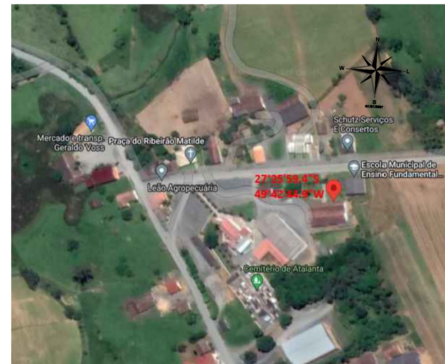
PLANTA DE LOCALIZAÇÃO ESCALA.....SEM